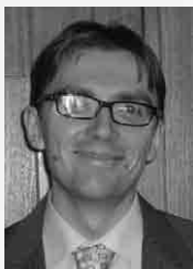
Piše: Marko Kokot, mag. pharm.

Kako bi se uopće moglo pristupiti reformi bilo kojeg od vitalnih sustava neke države, gospodarstva i društva, potrebno je najprije ustanoviti koji je zakonski temelj podložan eventualnim promjenama što definira pitanja premetna za reformiranje i čini osnovu za daljnje preciziranje rada unutar sustavnih cjelina.