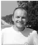
Piše: Hrvoje Petrić

Ulaganje u znanje je dugotrajan, ali vrlo isplativ proces. Trenutno nemamo ni minimalne uvjete za dobivanje dopusnice o ispunjavanju uvjeta za početak djelatnosti visokog učilišta