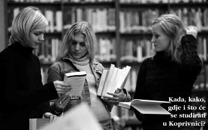
Kada, kako, gdje i što će se studirati u Koprivnici?

punim radnim vremenom s najmanje polovicom potrebnog broja nastavnika u slučaju sveučilišta, odnosno s najmanje jednom trećinom u slučaju veleučilišta i visokih škola. Sveučilištu koje nema u radnom odnosu najmanje polovicu potrebnog broja nastavnika, a veleučilištu i visokoj školi najmanje jednu trećinu, može se izdati dopusnica uz uvjet da u razdoblju od pet godina ravnomjerno zapošljava nastavnike do potrebnog broja i o tome jednom godišnje izvještava ministra; 3. osiguran odgovarajući prostor i opremu, u skladu s brojem studenata koje visoko učilište namjerava upisati i potrebama kvalitetnog studiranja, i 4. osigurana potrebna novčana sredstva za svoj rad. Što je od toga osigurano u Koprivnici? Ništa. Ni ustupanje bivše koprivničke vojarne lokalnoj zajednici ne bi, samo po sebi, stvorilo preduvjete za osnivanje visokog učilišta jer ono jednostavno ne bi imalo spomenute minimalne uvjete za dobivanje dopusnice.