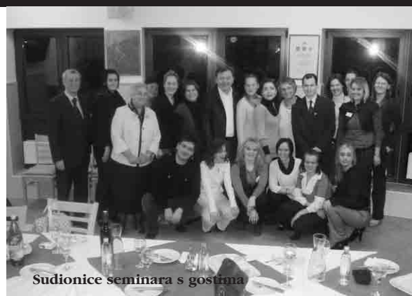
Sudionice seminara s gostima